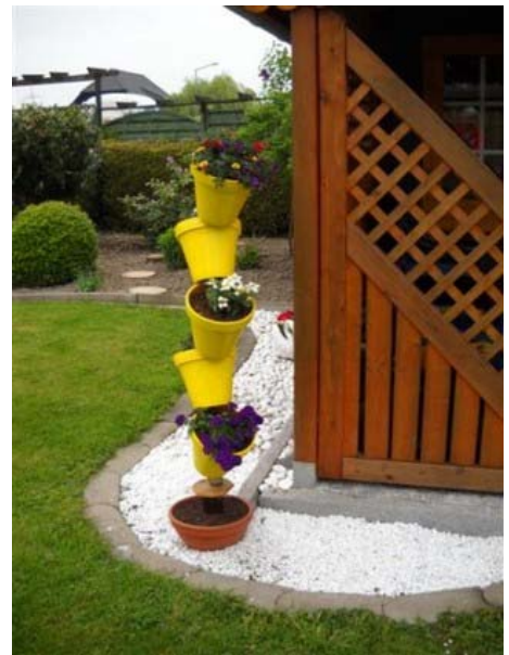
Eine schöne Dekoration neben Hamels Züchterstube