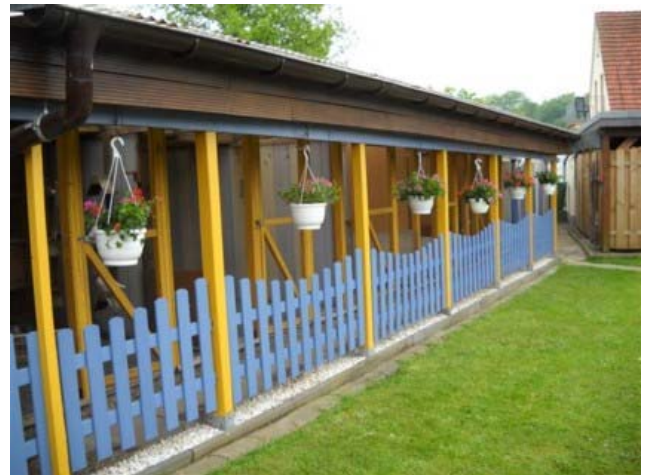
Blick auf die Zuchtanlage