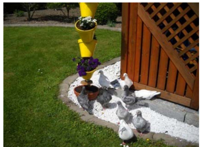
Junge Texanertauben im Garten