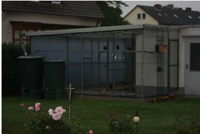
In der schönen Gartenanlage von Günter Blotenberg konnte man die Tauben in seinem Schlag beobachten.