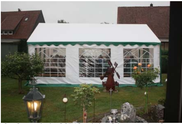
Das Partyzelt des RGZV Bünde bot Schutz vor dem Regen.