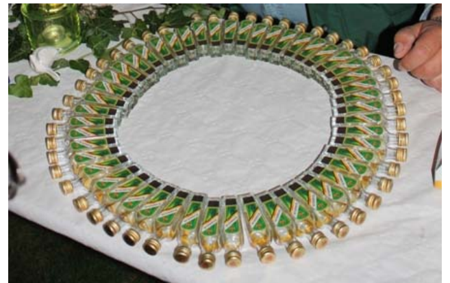
Geschafft: Satte 50 Schluckfläschchen wurden von den Mitgliedern "vernichtet".