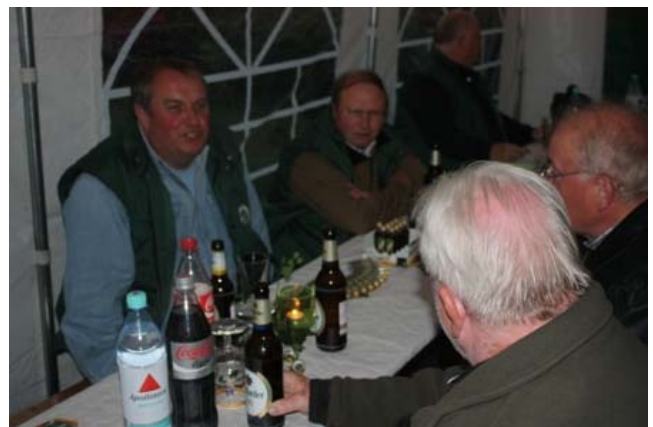
... und erfrischend getrunken.