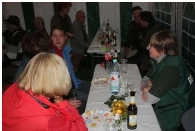
Auch die "Züchter"-Frauen fühlten sich auf dem Fest wohl.