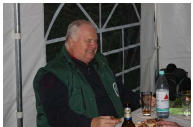
Auch Erhard ist gut gelaunt.