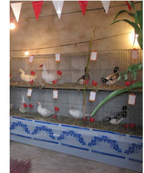
Abteilung Puten, Gänse und Wassergeflügel.

Sigertafel Senioren + Jugend. Klaus Reichl freut sich über den 3. Platz bei der Stadtverbandsschau, da sein Verein Bünde jahrelang Platz 4 belegt hatte.