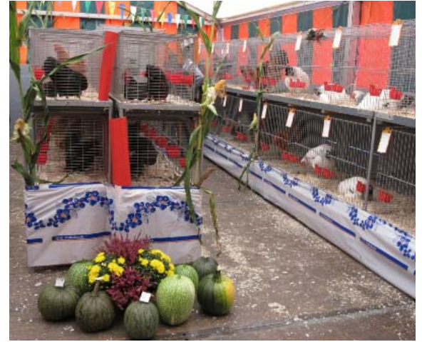
Ein schön dekoriertes Eingangsbereich zur Ausstellung.