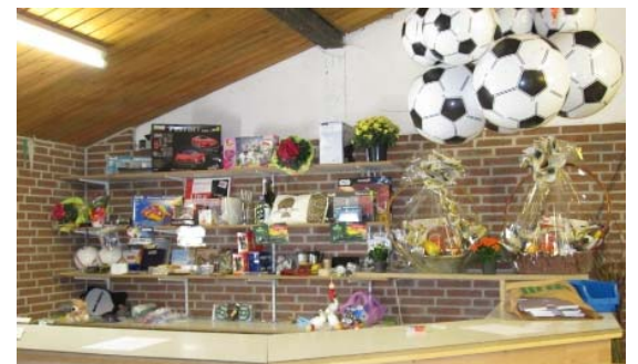
Ein Magnet für die Jugend waren die Tombola und die Hüpfburg.