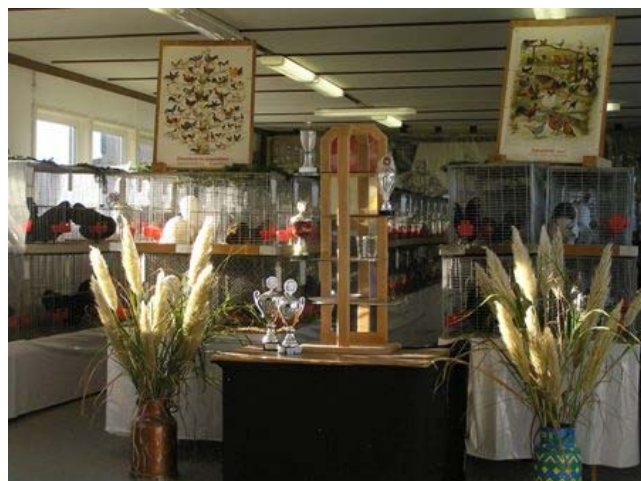
Blick in die Ausstellung.

Der Bürgermeister Bernd Dumcke gab zu beim Rundgang durch den Ausstellungsraum schon einiges gelernt zu haben, natürlich bin ich noch kein Fachmann, aber die Tiere sind alle in einem guten Zustand. Die Lokalschau ist wohl der Höhepunkt im Vereinsleben und ist auch als Erntedankfest des einzelnen Züchters zu bewerten. Die Gemeinschaftsschau der Spenger Geflügelvereine ist ein guter Ansatz die wachsenden Probleme, durch die schrumpfenden Züchterzahlen zu überwinden. Dieses Konzept kann auch für andere Vereine zum Vorbild werden.