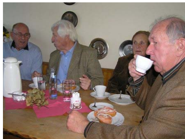
Die Züchterfreunde aus Blasheim.