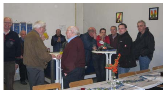
Der Getränkestand war ständig umlagert.