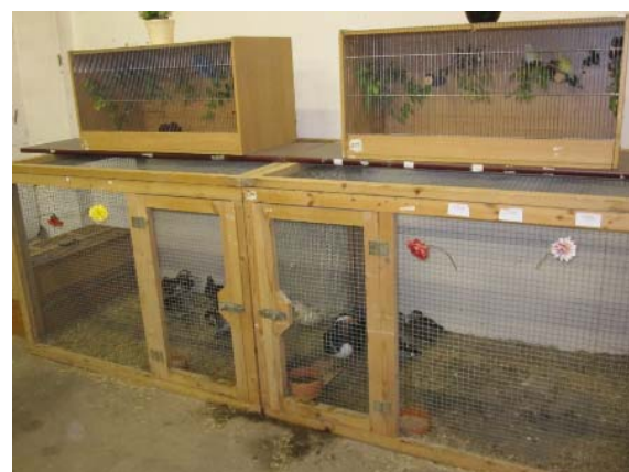
Die Ziergeflügelabteilung war der Hingucker