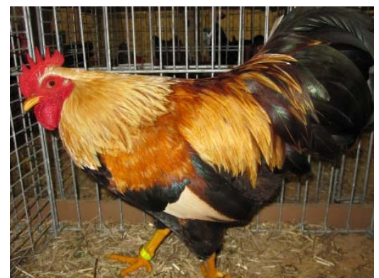
und die Zwerg Welsumer von Werner Nölkenhöner mit V 97 KVE.