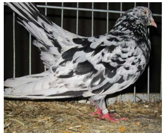
die Orientalische Roller von Bernd Rekersbrink mit V 97 Pokal,